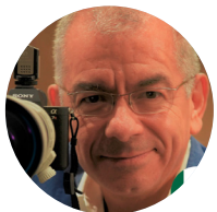
JORGE SANDOVAL Fotografo electoral JORGE SANDOVAL