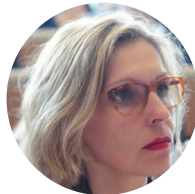
BEATRIZ BECERRA Eurodiputada ALDE (ALIANCE FOR LIBERALS AND DEMOCRATS FOR EUROPE)